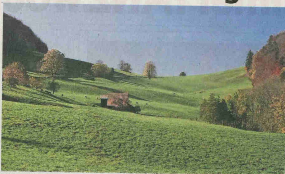
Blick auf die Breitenhöchi.

Langenbruck Tourismus hat in Zusammenarbeit mit Gemeinde, Wanderwege beider Basel und Wanderwege Solothurn das Wanderwegnetz von Langenbruck um fünf attraktive Rundwanderwege in der nahen Umgebung des Dorfes ergänzt. Diese werden anlässlich des Banntages vom 30. Mai eröffnet. Alle Wegweiser sind mit weißen Wegweisern ausgeschildert. In ein bis zweieinhalb Stunden lassen sich die verschiedenen angelegten Wege begehen. Sie eignen sich ganz besonders für Familien. Start und Ziel ist jeweils auf dem Postplatz in Langenbruck. Infotafeln auf den markanten Punkten geben Auskunft über den jeweiligen Wegverlauf. Auf jedem der fünf Rundwanderwege kommen sie an einem Bergrestaurant oder einer Feuerstelle vorbei. Auf den einfachen und gut ausgeschilderten Wanderungen kann man zuerst die