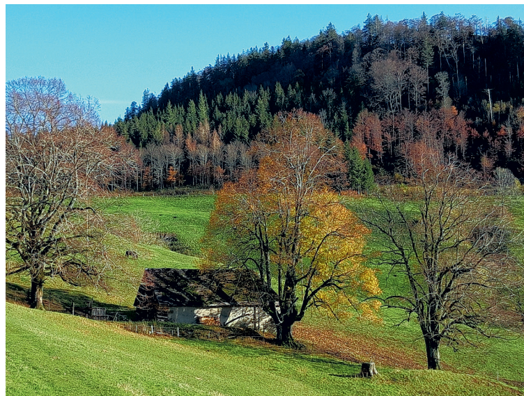
Scheune beim Chilchzimmer