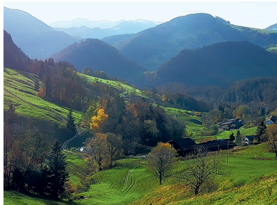
Blick vom Chilchzimmersattel