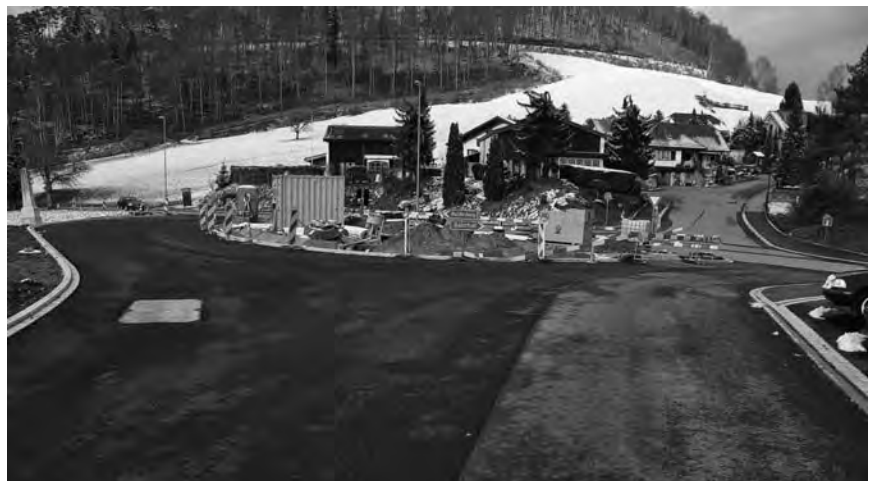
Baustelle Passhöhe Inseli

Die Brücke ist im Rohbau fertiggestellt und die Zufahrtsrampen sind in Arbeit. Zurzeit wird die Mauer zum Werkhof Flury erstellt. Anschliessend wird die Hauptstrasse ab Solarbob in Richtung „Bären,“ aufgebrochen und die Strassenbau- sowie die Werkleitungsarbeiten durchgeführt. Anfangs Mai werden die Strassenbauarbeiten sowie die Arbeiten an der neuen Bärenwilerbrücke soweit fertig sein, dass die Brücke für die Umfahrung während der Totalsperre vom 17. Mai bis 8. Juli 2016 befahren werden kann. Bedingt durch die engen Verhältnisse, muss die Ortsdurchfahrt während dieser Zeit für den Schwer-