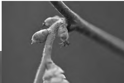
Abb. 1 Die männlichen Kätzchen des Haselstrauchs sind sehr auffällig, während die weiblichen Blüten nur mit den roten Narben aus den Knospen ragen (vergrößerter Ausschnitt) und erst bei näherer Betrachtung erkennbar sind.

im Herbst, um für den ausserordentlich frühen Blühbeginn bereit zu sein. Weibliche Blüten sind hingegen unauffällig und gut geschützt in den Blattknospen verpackt. Nur die leuchtend roten Narben ragen als Pollenfänger heraus (Abb. 1). Und damit der windverfrachtete Blütenstaub auf den weiblichen Blüten ankommt, blühen Hasel noch vor dem Laubaustrieb, denn die Blätter würden den Pollenkörnern den Weg zu den weiblichen Blüten versperren.