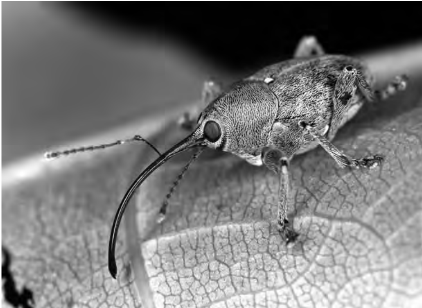
Abb. 2: Der nur 5-7mm kleine Haselnussbohrer gehört zur Familie der Rüsselkäfer. Er ist vom Eichelbohrer (hier im Bild) fast nicht zu unterscheiden.