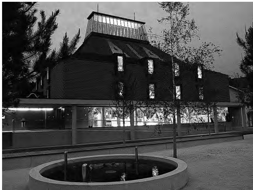
KBL Neuer Platz